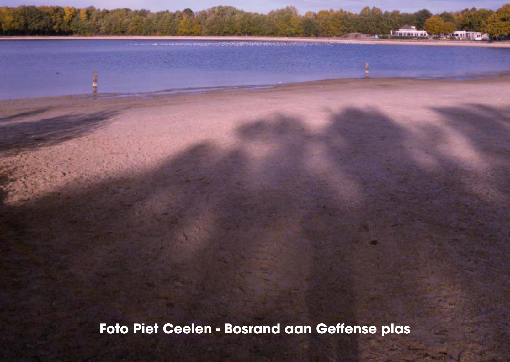
Bosrand aan Geffense plas