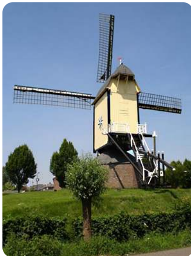
Molen De Windlust Nistelrode