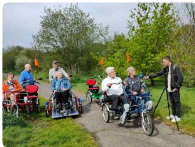
interview door DTV