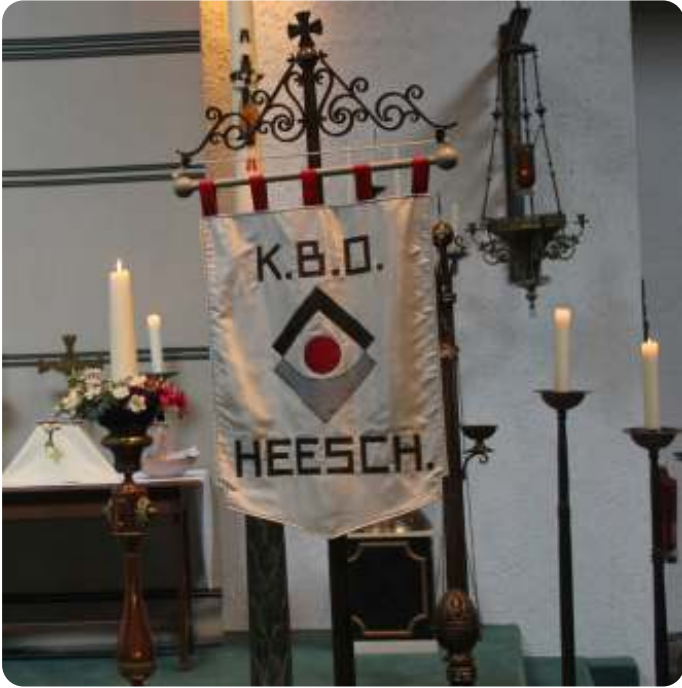
De KBO-dag begon met een H. Mis in onze kerk