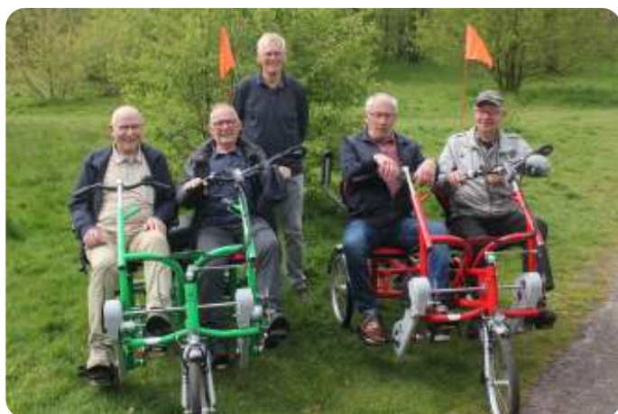
de werkgroep "Duo fietsen"