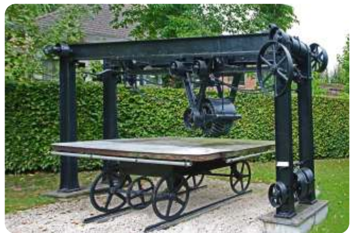
Fotoclub - Jo van Herpen - Leerlooiershuisje Ravenstein